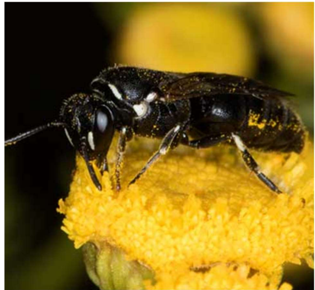
Abbildung 2 Weibchen